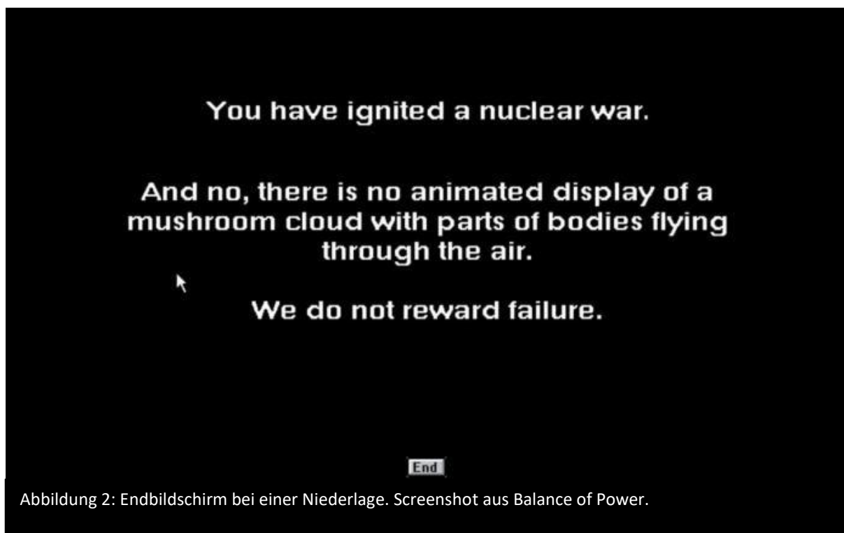
Abbildung 2: Endbildschirm bei einer Niederlage. Screenshot aus Balance of Power.

Wenn bis ins Jahr 1997 kein Krieg ausgelöst wurde, gewinnt die Supermacht mit dem höheren Prestige.