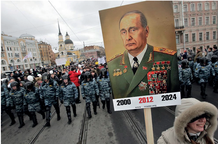
Abb. 4: Eine Demonstrantin trägt ein Plakat, das Putin als älteren sowjetischen Generalsekretär mit Zügen Leonid Breschnews zeigt. St. Petersburg, 25. Februar 2012.