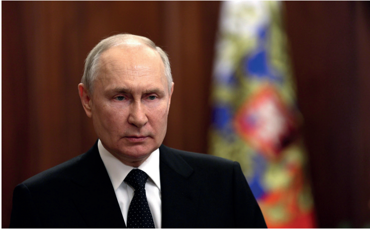
Abb. 1: TV-Ansprache Wladimir Putins, 24. Juni 2023.