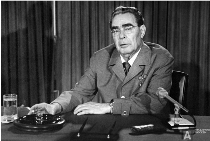
Abb. 3: Generalsekretär des ZK der KPdSU, Vorsitzender des Präsidiums des Obersten Sowjets der UdSSR Leonid Breschnew während der Aufzeichnung einer Rede im Fernsehen.