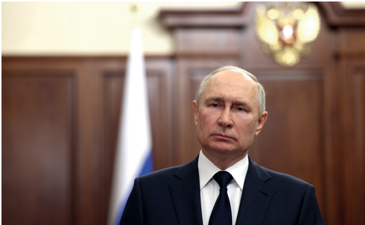
Abb. 2: TV-Ansprache Wladimir Putins, 26. Juni 2023.