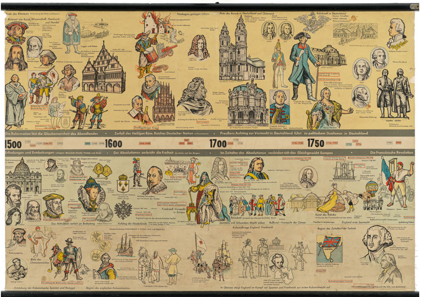
Die Frühe Neuzeit als Gruppenbild mit Dame. Schulwandbild „Geschichtsfries 1500-1750“, Tellus Verlag Essen, 1963-1976.