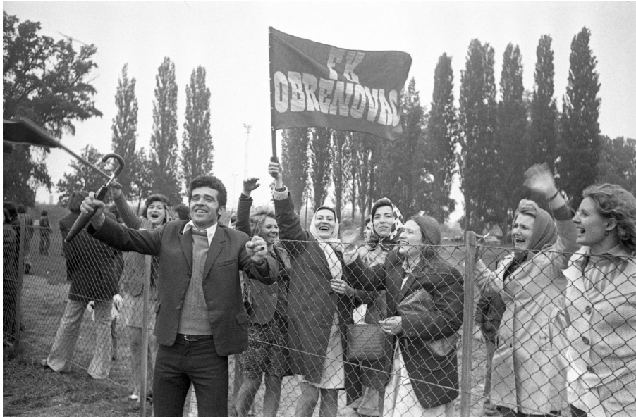
Abb. 2: Jovan Ritopečki, Zuschauer:innen beim Finalspiel des Fußballturniers „Tag der Jugend“, Wien, Prater, 1975.