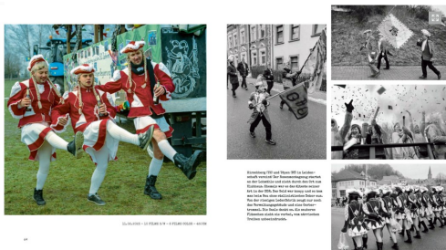
Ulrich Kneise: Karneval Hirschberg (TH) und Töpen (BY), in: Kneise/Stückrad, Randgebiete, Doppelseite 64/65 © Ulrich Kneise / Bundesstiftung zur Aufarbeitung der SED-Diktatur

So schuf Ulrich Kneise nicht nur brillante Fotos, sondern dieses Vorgehen ermöglicht ihm auch einen Verweis auf den Umfang des von ihm belichteten Filmmaterials. Am Anfang der jeweiligen Tagebuchnotizen stehen Angaben wie „9 Filme S/W – 3 Filme Color“ (S. 27) oder „48 Filme S/W – 8 Filme Color“ (S. 76). Aber auch das Datum der Aufnahmen und die dafür zurückgelegten Autostrecken von bis zu 771 km (S. 178) sind hier vermerkt. Dennoch sind die Fotos im Buch oft nicht chronologisch nach ihrem Entstehungsdatum abgebildet, weil Kneise einzelne Orte wiederholt aufsuchte, um sie „im richtigen Licht“ fotografieren zu können. „Muss wiederkommen!“ (S. 27), notierte er dann lakonisch in seinem Reisetagebuch. All dies zusammen ergibt einen tiefen Einblick in die Werkstatt eines Fotografen, wie man ihn nur selten bekommt.