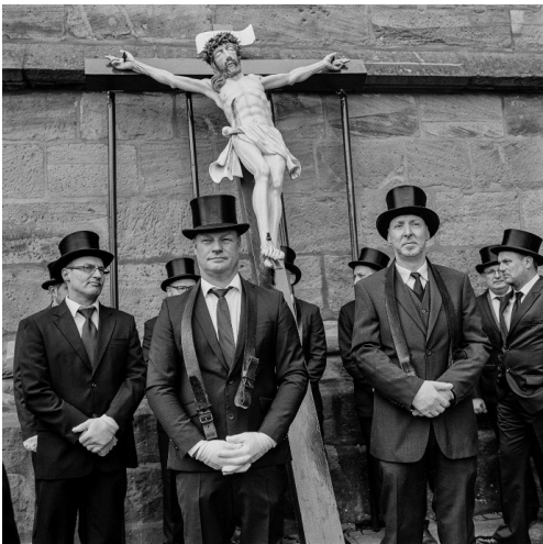
Ulrich Kneise, Palmsonntag-Prozession in HB Heiligenstadt, in: Kneise/Stückrad, Randgebiete, S. 23 © Ulrich Kneise / Bundesstiftung zur Aufarbeitung der SED-Diktatur

Zu sehen sind aber auch Freiwillige Feuerwehren in Ost und West bei gemeinsamen Übungen und Freizeitvergnügen (S. 34-41), die verbindende und trennende Kraft religiösen Glaubens rechts und links der ehemaligen Grenze (S. 50-59) oder das karnevalistische Brauchtum, das sich hier trotz unterschiedlicher gesellschaftlicher Systeme in (durchaus) vergleichbarer Form erhalten hat (S. 60-85). Neu belebt wurde nach 1990 in Eisenach dagegen die unselige Tradition der „Deutschen Burschenschaften“, die nun wieder vor dem 1902 von ihnen, in Erinnerung an die Reichsgründung von 1871, errichteten Denkmal aufmarschieren können (S. 112-115).