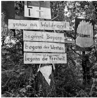
Ulrich Kneise, Schilder an der ehemaligen Grenze zu Bayern („Freiheit“), in: Kneise/Stückrad, Randgebiete, S. 3 © Ulrich Kneise / Bundesstiftung zur Aufarbeitung der SED-Diktatur

Dem steht jedoch das Foto entgegen, mit dem Ulrich Kneise den Band (auf S. 3) beginnen lässt. Es zeigt eine Abfolge von vier schmalen Sperrholzschildern, die übereinander an einen Baum an der westlichen Seite der ehemaligen Grenze zur Bundesrepublik bei Mellrichstadt (BY) genagelt wurden. Auf diesen Schildern steht – von oben nach unten gelesen – „genau am Waldrand“ (Schild 1) „beginnt Bayern“ (Schild 2) „begann der Westen“ (Schild 3) „begann die Freiheit“ (Schild 4). Auf das letztgenannte Schild hat (offensichtlich) ein Ostdeutscher den Kommentar hinzugefügt: „So können nur Wessis denken“ und „US-Besetzt“. Noch bleibt, über 30 Jahre nach der staatlich vollzogenen Einheit Deutschlands, mental vieles offen – nicht nur in den ehemaligen Randgebieten.