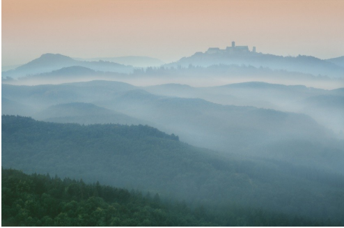
Ulrich Kneise: „Hinter sieben Bergen: Der Blick zur Wartburg (TH) war für mich als Kind eher Traum als Wirklichkeit, immer verbunden mit der Gewissheit, dass es hinter dem Horizont weitergeht.“ Kneise: Wartburg, in: Kneise/Stückrad, Randgebiete, S. 17

So schuf Ulrich Kneise nicht nur brillante Fotos, sondern dieses Vorgehen ermöglicht ihm auch einen Verweis auf den Umfang des von ihm belichteten Filmmaterials. Am Anfang der jeweiligen Tagebuchnotizen stehen Angaben wie „9 Filme S/W – 3 Filme Color“ (S. 27) oder „48 Filme S/W – 8 Filme Color“ (S. 76). Aber auch das Datum der Aufnahmen und die dafür zurückgelegten Autostrecken von bis zu 771 km (S. 178) sind hier vermerkt. Dennoch sind die Fotos im Buch oft nicht chronologisch nach ihrem Entstehungsdatum abgebildet, weil Kneise einzelne Orte wiederholt aufsuchte, um sie „im richtigen Licht“ fotografieren zu können. „Muss wiederkommen!“ (S. 27), notierte er dann lakonisch in seinem Reisetagebuch. All dies zusammen ergibt einen tiefen Einblick in die Werkstatt eines Fotografen, wie man ihn nur selten bekommt.