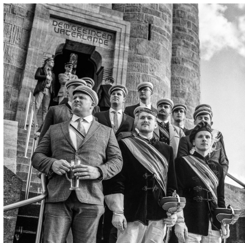
Ulrich Kneise, Treffen „Deutscher Burschenschaftler“ in Eisenach, in: Kneise/Stückrad, Randgebiete, S. 113

Und immer wieder kommen Rudimente der einstigen Grenzanlagen ins Bild, mit denen die DDR ihre Bewohner vom Westen abzuschotten versuchte und verwandtschaftliche Beziehungen erschwerte. Aber auch den wirtschaftlichen Niedergang im ehemaligen Zonenrandgebiet, als nach 1990 die speziellen Förderprogramme der Bundesregierung für diese Regionen ausliefen, rückt Kneise ins Bild, ebenso den (oftmals aussichtslosen) Kampf ehemaliger Volkseigener Fabriken im Osten um ihr Überleben. Die Fotos dokumentieren aber auch das beherrzte Engagement mittelständischer Unternehmer, traditionsreiche Betriebe wiederzubeleben. Ein ganzes Universum an Leben führt uns Ulrich Kneise hier in nicht länger abseitigen Randgebieten vor.