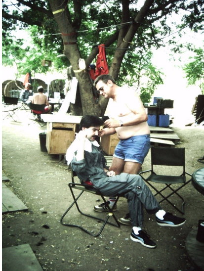
Abb. 3: Ein Bundeswehrsoldat schneidet einem Kameraden im Camp von Dire Dawa die Haare, 1985.