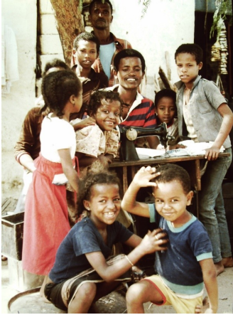
Abb. 9: Äthiopische Kinder bei einem Schneider in Dire Dawa, 1985.