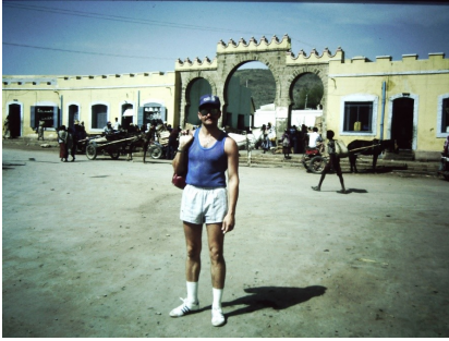
Abb. 11: Ein Bundeswehrsoldat in Zivilkleidung im Stadtzentrum von Dire Dawa, 1985.