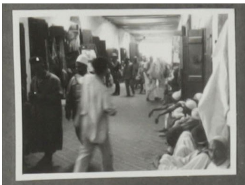
Abb. 8: Alltagsszene im nordafrikanischen Libyen (Marktpassage?); im Fotoalbum ist das Bild mit weiteren Aufnahmen unter der Überschrift „Orientalische Stimmungsbilder“ zusammengefasst, 1941/42. Fotograf unbekannt. Quelle: Sammlung eines nicht bekannten Soldaten des „Deutschen Afrikakorps“ / MHMBw Flugplatz Berlin-Gatow, Inv. Nr. ABAB1713