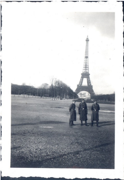
Abb. 12: Luftwaffensoldaten der Wehrmacht posieren im besetzten Paris vor dem Eiffelturm, 1940. Fotograf unbekannt. Quelle: Sammlung des Wehrmachtssoldaten Günter K. / MHMBw Flugplatz Berlin-Gatow, Inv. Nr. ABAB8041

Die Fotografien aus Äthiopien dienten den Beteiligten einmal mehr als visueller Beweis und Hilfsmittel der Kommunikation [56] gegenüber ihrem persönlichen Umfeld – und zwar wiederum bezüglich unterschiedlichster Facetten des Einsatzes, also nicht nur hinsichtlich der positiv konnotierten Eindrücke aus der Freizeit. Ein damals nach Äthiopien entsandter Bundeswehrsoldat sagte rückblickend in diesem Zusammenhang: „[M]an hat ja einige Filme verschossen, dann konnt man auch mit Bildern [...] zeigen: Horch zu, schau, so hat des ausgeguckt! Das ham mir gemacht!“ [57]