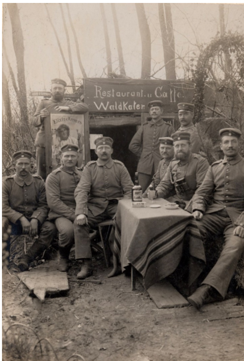
Abb. 2: Inszeniertes Gruppenfoto vor einem Unterstand, der am westlichen Kriegsschauplatz (wohl Flandern in Belgien) von deutschen Soldaten als eine Art Gaststätte gestaltet wurde, 1915/16. Fotograf unbekannt. Quelle: Sammlung eines nicht bekannten deutschen Kombattanten des Ersten Weltkrieges / MHMBw Flugplatz Berlin-Gatow, Inv. Nr. ABAB5296