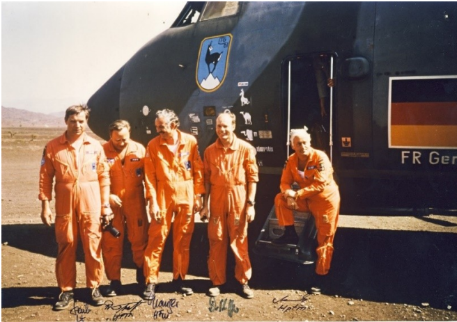
Abb. 5: Gruppenbild einer Transall-Besatzung der Bundeswehr vor ihrem Flugzeug (mit Unterschriften der abgebildeten Personen). Auf der Bordwand ist die Abwandlung einer „Abschussliste“ mit Bezug auf Tierkollisionen zu erkennen, 1985.