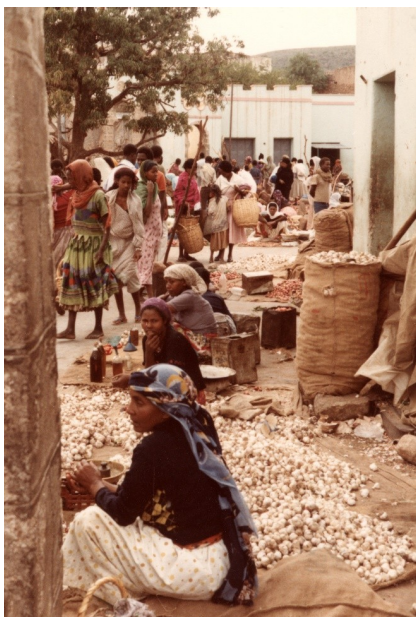
Abb. 7: Der Gewürzmarkt in Dire Dawa, 1985.

Die entsprechenden Aufnahmen aus Äthiopien zeigen den Einsatz daher ebenfalls als eine Art „Reise“. Schließlich war ein Aufenthalt am Horn von Afrika in der Mitte der 1980er Jahre für Deutsche aus Ost, aber auch aus West, keineswegs etwas Normales. [48] Ein damals an der Hilfsaktion beteiligter Bundeswehrsoldat sagte im Zeitzeugengespräch: „[I]ch fand das natürlich sehr [...] interessant! Ja? Das zu sehen! Wann hat man schon mal die Gelegenheit, da hinzukommen.“ [49] Eine Entsendung in ferne Länder, die nicht zu den üblichen Zielen des Tourismus zählen, gilt sicherlich für viele Soldatinnen und Soldaten bis zum heutigen Tage als etwas Besonderes. [50]