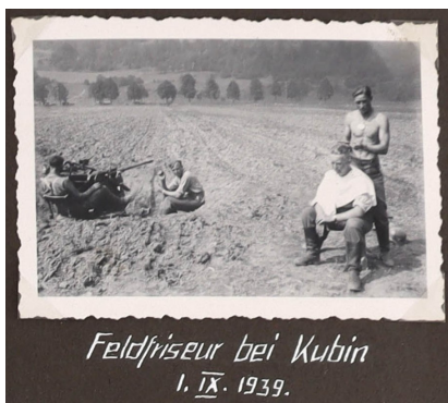
Abb. 4: „Feldfriseur“ bei einer Einheit der Flakartillerie (Flugabwehrartillerie) der Wehrmacht; bei Vyšný Kubín oder Dolný Kubín (Ober- oder Unterkubin) in der Slowakei, 1. September 1939. Fotograf: Wehrmachtssoldat Wilfried S. Quelle: Sammlung Wilfried S. / MHMBw Flugplatz Berlin-Gatow, Inv. Nr. ABAB8234

Zeitübergreifende Parallelen zeigen sich zudem – wenig überraschend – bei Aufnahmen der eigenen Person und solchen von Kameraden/Vorgesetzten.[32] Die Bilder entstanden auch in Äthiopien oft im geselligen Rahmen.[33] Das klassisch inszenierte Gruppenfoto als eine Art „traditionelle Form militärischer Selbstdarstellung“[34] erfreute sich in den Jahren 1984/85 ebenfalls großer Beliebtheit. Solche Aufnahmen der sozialen Gruppe stifteten Identität[35] und sind als ein visueller Ausdruck des Wir-Gefühls der Soldaten, sprich der Kameradschaft, zu verstehen.[36] Einen dafür gern gewählten Hintergrund bot wiederum das eigene Großgerät, vor dem man sich stolz präsentierte (siehe Abb. 5). Die Flugzeuge waren aber auch ohne Personen ein häufiges Motiv.[37] An dieser Stelle sei erwähnt, dass im Äthiopien-Einsatz die Regeln zum Fotografieren anscheinend nicht nur bei der Bundeswehr, sondern auch in den Reihen der NVA zumeist recht großzügig gehalten wurden. In den militärischen Sicherheitsbereichen der Heimatstandorte herrschten dagegen klare Fotografierverbote.[38] Zudem bestand ein großes Interesse an den Fluggeräten der jeweiligen Kontrahenten im Kalten Krieg. Sofern kein Sicherheitsrisiko wahrgenommen wurde oder man dieses aus der Distanz für sehr gering erachtete, ist hier ebenfalls der Auslöser gedrückt worden.[39]