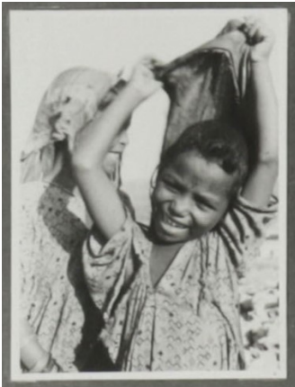
Abb. 10: Kind in Libyen, 1941/42. Fotograf unbekannt. Quelle: Sammlung eines nicht bekannten Soldaten des „Deutschen Afrikakorps“ / MHMBw Flugplatz Berlin-Gatow, Inv. Nr. ABAB1713

Während der Hilfeleistung in Äthiopien hatten die Einsatzkräfte immer mal wieder zeitliche Freiräume, um „sich was an[zu]gucken“.[51] So finden sich in den untersuchten Konvoluten viele Fotos, die „Land und Leute“ zeigen (siehe Abb. 7 u. 9).[52] Mit der Kamera wurden neugierig die Schönheit Äthiopiens und als landestypisch respektive „exotisch“ Empfundenes eingefangen. Fotos von Stränden, Palmen, Wasserfällen, Kamelen, Märkten oder Torbögen in einer Altstadt muten dabei wie ganz normale Urlaubsbilder an.[53] Solche Aufnahmen zeigen also nicht, dass sich die Soldaten in einem Bürgerkriegsland befanden, dessen Bevölkerung in Teilen[54] unter einer gewaltigen Hungersnot litt. Ähnlich verhielt es sich auch mit derartigem Bildmaterial aus dem Ersten und Zweiten Weltkrieg, welches das Grauen der Zeit ausblendete und so einen positiven Kontrast bilden konnte.[55] Ein auffälliger Unterschied zu touristisch geprägten Aufnahmen aus den Weltkriegen ist hier, dass die Soldaten 1984/85 – die eben nicht im Kriegseinsatz und keine Besatzungstruppen waren – in ziviler Kleidung vor als fotogen erachteten Motiven posieren konnten (siehe Abb. 11).