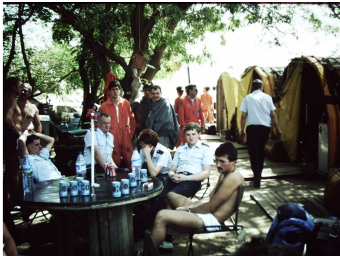
Abb. 1: Soldaten der Bundeswehr kurz nach ihrer Ankunft im äthiopischen Dire Dawa, 1985.

Auch die untersuchten Fotografien aus dem Äthiopien-Einsatz von Bundeswehr und NVA zeigen vornehmlich eine Art Alltag[29] des Militärs – in diesem Fall eben unter den genannten Rahmenbedingungen eines humanitären Auslandseinsatzes. Dazu gehören Aufnahmen aus dem Lagerleben. Solche Bilder aus dem Einsatzalltag[30] zeigen einmal mehr Improvisationen beziehungsweise ein Trotzen gegen allerlei Widrigkeiten in Bereichen wie Ernährung und Körperhygiene. So wurden beispielsweise eine zum Tisch umfunktionierte Kabeltrommel, das Verpflegungspaket „Einmannpackung“, das Duschen mit einer Wasserflasche oder aber die Reinigung der Wäsche und das Frisieren unter Einsatzbedingungen mit der Kamera festgehalten (siehe Abb. 1 u. 3).[31]