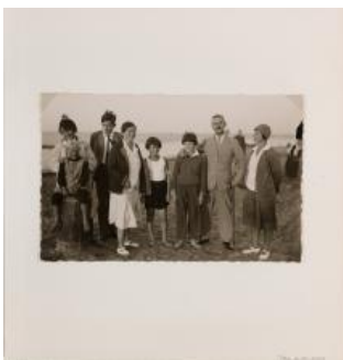
Familie Mann, 9. Februar 1930 in Nidden

Archiv-Version des ursprünglich auf dem Portal docupedia.de am 17.04.2026 erschiedenen Textes: https://docupedia.de/zg/neumaier_familie_v1_de_2026