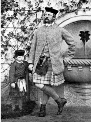
Szene einer grausamen Kindheit jenseits der christlich-bürgerlichen Kernfamilie: Prinz Wilhelm II. mit seinem Vater, Balmoral Castle, Oktober 1863.

Der semantische Wandel lässt sich als Verengung beschreiben: vom „Haus“, also der Gemeinschaft aller zu einem Haushalt gehörenden Personen, zur christlich-bürgerlichen Kernfamilie, die sich aus einem in einer Haushalts- und Wirtschaftsgemeinschaft lebenden heterosexuellen Ehepaar und gemeinsam gezeugten minderjährigen Kindern zusammensetzte.[26] Die christlichen Glaubensgrundsätze dieses Familienmodells zeigten sich, erstens, darin, dass dem Ehemann und Vater als Familienvorstand eine Vormachtstellung gegenüber Ehefrau und Kindern eingeräumt wurde. Neben der ausgeprägten hierarchischen Struktur dieses Familienmodells war, zweitens, die Ehe zwischen beiden Eltern konstitutiv für die Familie. Drittens galt die Erziehung der Kinder als genuine Pflicht der Eltern.[27]