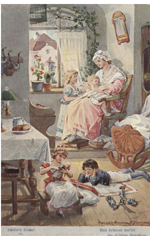
„Und drinnen waltet die züchtige Hausfrau“: Schillers „Lied von der Glocke“ vermittelte dem Bürgertum des 19. und frühen 20. Jahrhunderts die Trennung der Geschlechtersphären. Bildpostkarte von Hans Kaufmann, undatiert (um 1900). Quelle: Wikimedia Commons public domain

Der semantische Wandel lässt sich als Verengung beschreiben: vom „Haus“, also der Gemeinschaft aller zu einem Haushalt gehörenden Personen, zur christlich-bürgerlichen Kernfamilie, die sich aus einem in einer Haushalts- und Wirtschaftsgemeinschaft lebenden heterosexuellen Ehepaar und gemeinsam gezeugten minderjährigen Kindern zusammensetzte.[26] Die christlichen Glaubensgrundsätze dieses Familienmodells zeigten sich, erstens, darin, dass dem Ehemann und Vater als Familienvorstand eine Vormachtstellung gegenüber Ehefrau und Kindern eingeräumt wurde. Neben der ausgeprägten hierarchischen Struktur dieses Familienmodells war, zweitens, die Ehe zwischen beiden Eltern konstitutiv für die Familie. Drittens galt die Erziehung der Kinder als genuine Pflicht der Eltern.[27]