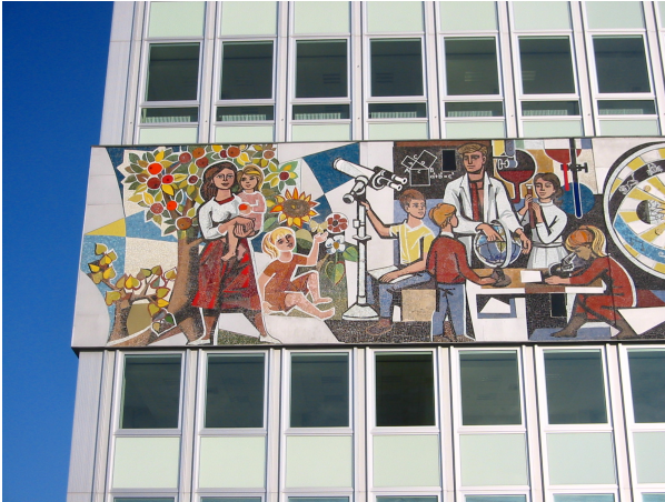
Auch in der DDR blieb die Kindererziehung in Frauenhand. Ausschnitt aus dem Bildfries „Unser Leben“ am Haus des Lehrers von Walter Womacka, Berlin 1964. Fotograf: Andreas Steinhoff ©, 30. August 2005. Quelle: Wikimedia Commons

Demgegenüber erfuhren in der Bundesrepublik der 1950er-Jahre „Nur-Hausfrauen“ eine besondere Wertschätzung, die jedoch ab den 1960er-Jahren erodierte, als sich die weibliche Teilzeitarbeit zum Ideal entwickelte. Daher fungierte zunächst das „ als Leitbild, das sukzessive durch das „Ernährer-Zuverdienerin-Modell“ substituiert wurde.[122]