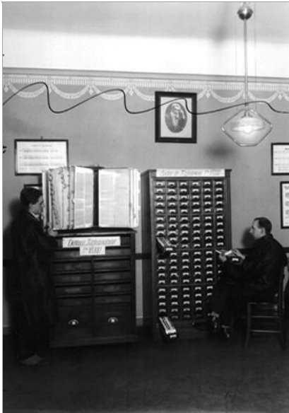
Gewerkschaft der Post- und Telegraphenbediensteten Wien: Mitgliederkataster und Karteikasten von Gewerkschaftsmitgliedern, Foto zwischen 1918 und 1938.