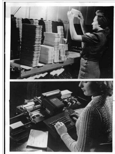
Lochkartenverfahren: oberes Bild: Händische Nachkontrolle, unteres Bild: Eine Locherin an einem Alphabetlocher. Weltbild, 6. November 1942.

Die zunehmende Öffnung der Verwaltung geht einher mit einem neuen Verständnis von Behörden, die nicht mehr länger als normativ festgelegter Handlungsraum verstanden werden. Petra Hiller sieht diese Verwaltungseinrichtungen in materieller wie prozeduraler Hinsicht klar festgelegt – durch Räumlichkeiten, Personal, Technologien, Verfahrensvorschriften und Arbeitsplatzbeschreibungen. Gleichzeitig betont sie deren Unbestimmtheit und Flexibilität – durch die Konstitution, Diskussion und Entscheidung von Fällen. Normative Vorgaben dienen dabei weniger als Festlegung, sondern eher als Ressource, mit der sich die Beamten gegenüber möglichen Einsprüchen absichern können. [134] Michael Lipsky hat solche Überlegungen in seiner Auseinandersetzung mit der sogenannten street-level bureaucracy noch weiter zugespitzt. Aus seiner Sicht wird bei der Entscheidung von Einzelfällen sowie in der Kommunikation zwischen Beamten und Klienten Politik gemacht und nicht zu Normen gewordene politische Vorgaben umgesetzt: „[...] the decisions of street-level bureaucrats, the routines they establish, and the devices they invent to cope with uncertainties and work pressure, effectively become the public policies they carry out“. [135]