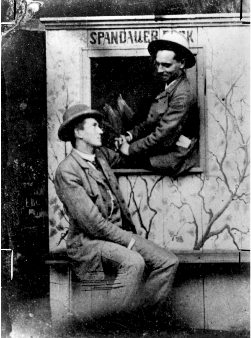
Oskar Cohn und Karl Liebknecht, vermutlich während ihrer Studienzzeit Anfang der 1890er-Jahre im Ausflugslokal »Spandauer Bock«