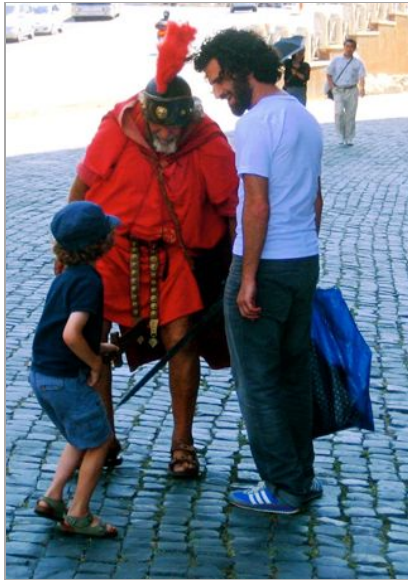
Straßenszene vor dem Colosseum in Rom, 28.7.2010