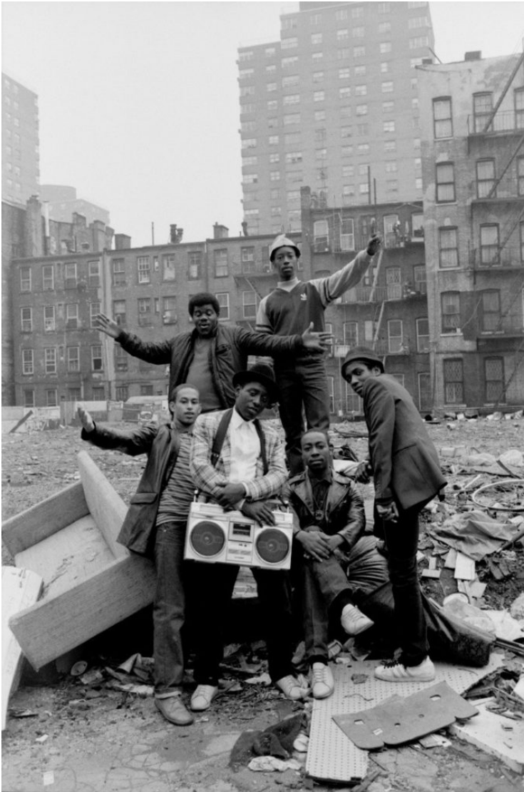
Selbstbewusst in der Tristesse: K-Slay, Dollar Bill und weitere Crewmitglieder 1981