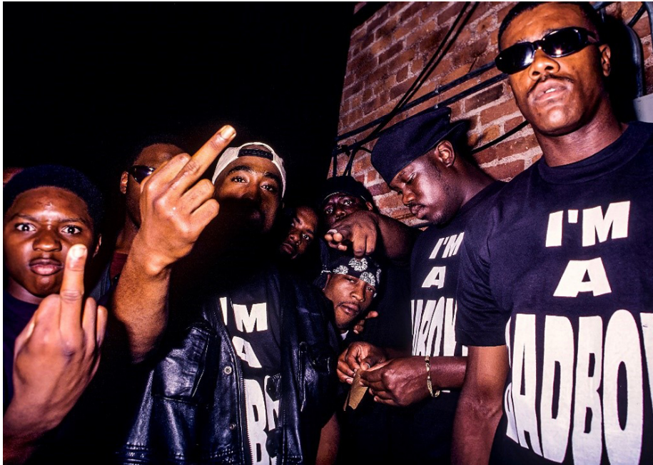
Die zwei wohl prominentesten Gewaltopfer der Hip-Hop-Szene: 2Pac (im Vordergrund, 2.v.l.) und The Notorious B.I.G. (im Hintergrund, 2.v.l.), hier im Jahr 1993 noch gemeinsam auf einem Foto

Allerdings wäre der 50. Geburtstag des Genres gleichsam eine Möglichkeit gewesen, einen kritischen Blick auf Geschichte und Gegenwart des Hip-Hop zu werfen und zum Nachdenken anzuregen. Diese Chance verpasst die Ausstellung leider.